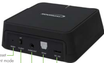
Reset AP/Client mode switch 3.5mm Phone Jack S/PDIF Micro-USB Port